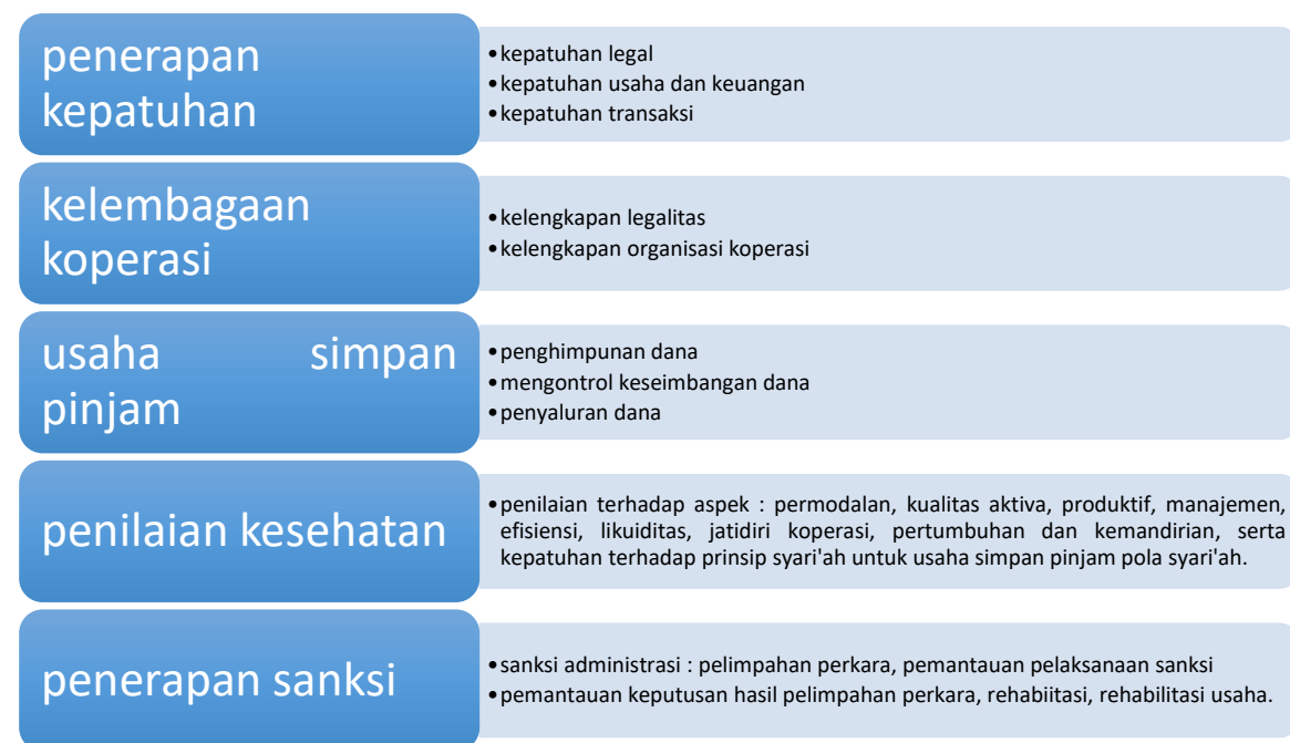
Gambar 4.2. Ruang Lingkup Pengawasan Koperasi

Sebagai badan hukum, koperasi terikat untuk tunduk kepada aturan perundangan yang ada. sebagaimana kita ketahui, aturan perundangan tersebut bisa yang berasal dari luar koperasi (eksternal) yang biasa kita sebut sebagai hukum publik, atau yang berasal dari dalam koperasi (internal) yang biasa kita sebut sebagai hukum privat. Koperasi sebagai “self regulating body “ bisa membuat aturan untuk dirinya sendiri dalam rangka menjalankan operasinya sebagai badan usaha.